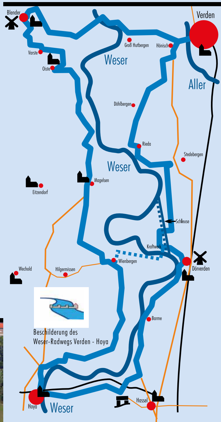
Beschilderung des Weser-Radwegs Verden - Hoya