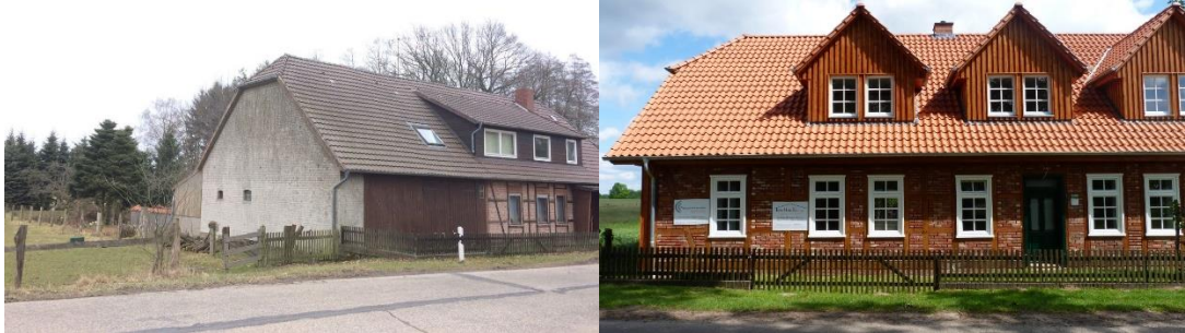
Ein Gebäude Vor- und nach der Förderung