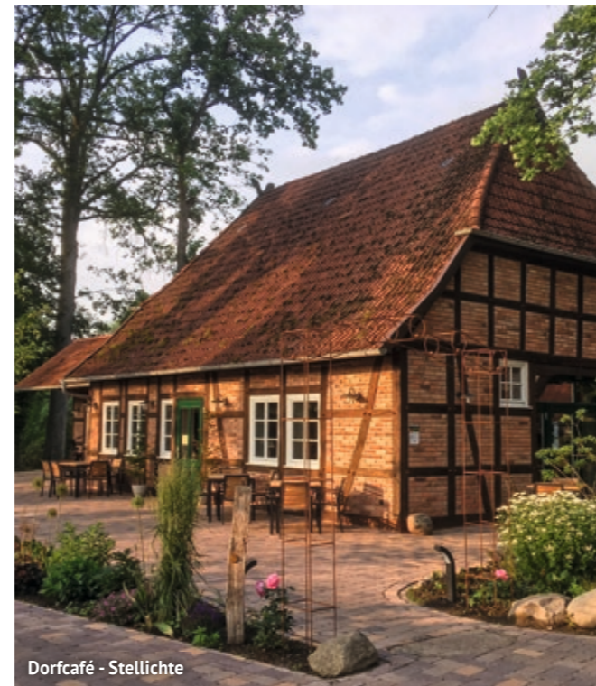
Dorfcafé - Stellichte

Stadt Verden (Aller) , Tourist-Information, Große Straße 40, 27283 Verden (Aller), Tel. 04231 - 12345, touristik@verden.de , www.verden.de